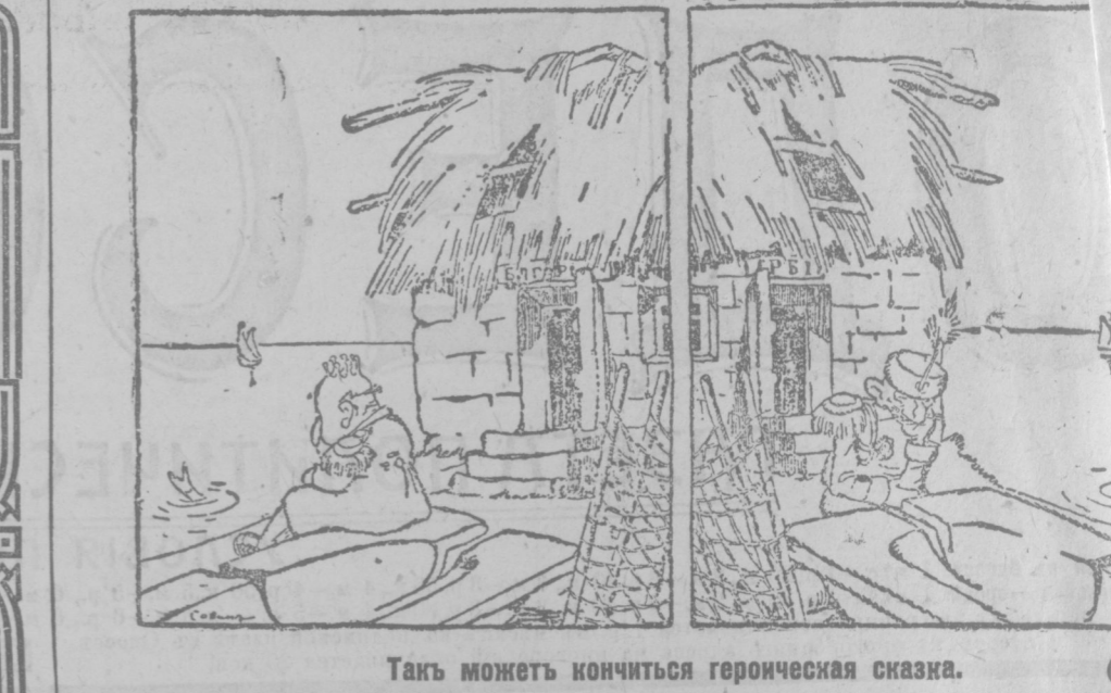
Таку можетъ починиться героическая сказка.