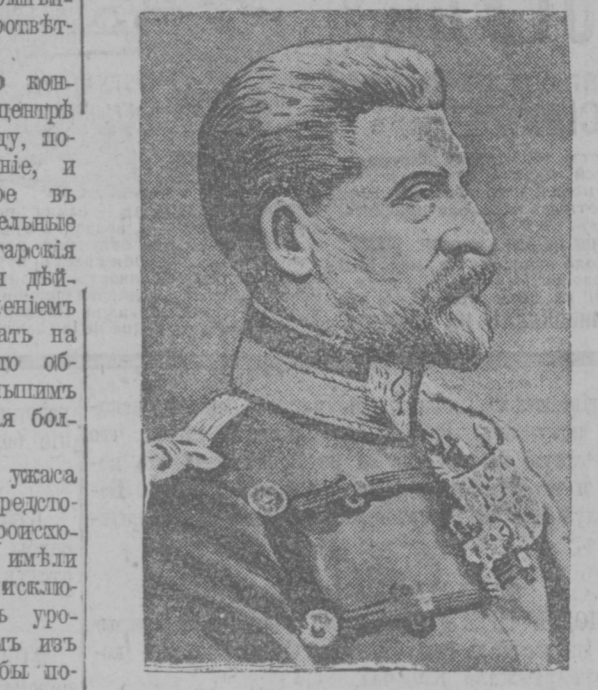
Румынскій князь принцъ Фердинандъ, назначенный главнокомандующимъ румынской арміи.