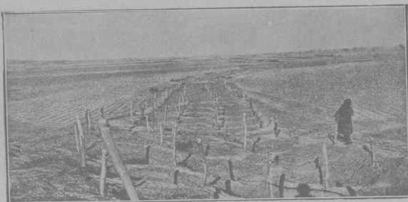
Общій видъ проволочныхъ загражденій.