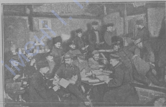
Выборка корреспонденцій въ полевой почтово-телеграфной конторѣ 6-го Сибирск. корпуса.