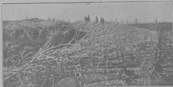
Общій видъ минныхъ загражденій.