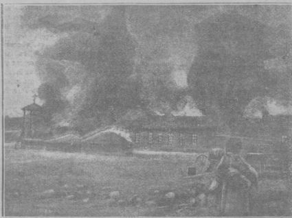
Пожаръ 42-го передового передвижнаго госпиталя въ Мукденѣ въ день отступленія.