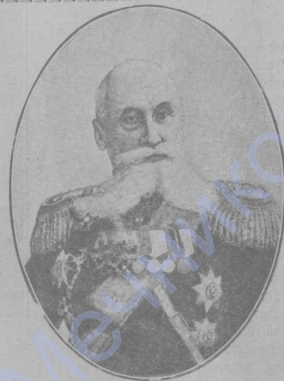
Генераль Топоринъ, командиръ 16 Сибирск. корпуса.