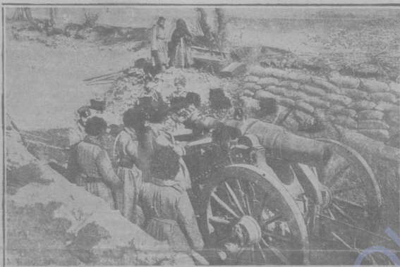
Осадная мортирная батарея, готовая къ дѣйствию.