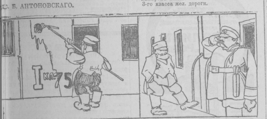
Предварительно вагоны I-го класса были по-прежнему по III-й.

Тот, министра путей сообщения Шухит, находит инкогнито... 3-го класса ж.д. дороги.