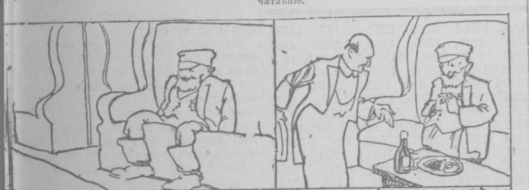
Потугувание отомления кондуктора (прибавка жалования) произошло на меня приятное впечатление.