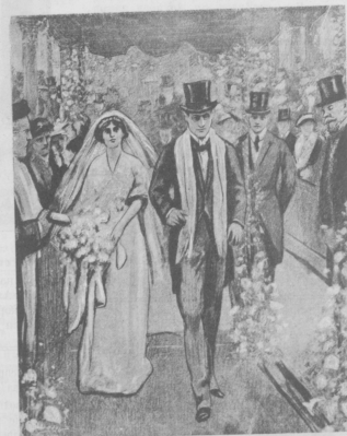
Бракосочетаніе одного изъ Ротшильдовъ.

Спускъ съ парохода сенегальскихъ стрѣлковъ съ оружіемъ и вещами въ Гранъ-Басемъ.