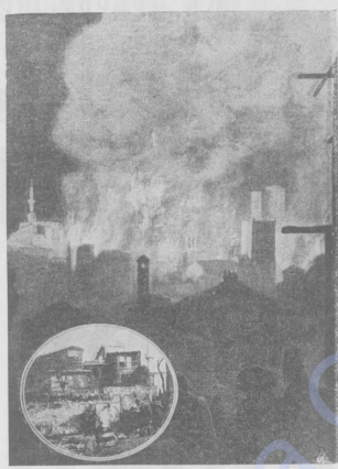
Ночной пожаръ въ Константиноплѣ, уничтожившій цѣлый кварталъ домовъ, примыкающій къ мечети Али-Собханъ.