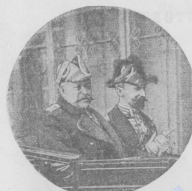
Русскій посланникъ въ Парижѣ Николай Ивановичъ Шиллингъ

Самый беззаботный человекъ на свѣтѣ—это покойно, но все еще галантный баронъ К. У него только одна слабость: это страсть къ вѣселичеству. Да, это была его слабость.