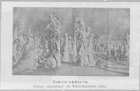
Зимние эффе́нты. Бывшие «призраки» в Финляндском лесу.