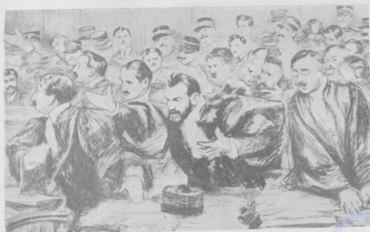
Смятеніе среди защитниковъ и подсудимыхъ во время произнесенія смертнаго приговора пяти бандитамъ.

Всѣ ушхренія старика, желавшаго во что бы то ни стало святая, разболѣлъ о