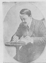
Марсель Преву, знаменитый французскій романистъ. (Съ послѣдняго портрета).