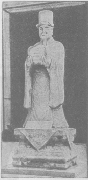
Ирморнал статуя корейскаго маандарина. Статуя эта, на-дняхъ поднесенная музею Виктории и Альберта въ Лондонѣ, изображаетъ корейскаго маандарина. Она откопана въ 15 или 16 столѣтіи.

въ тонѣ,—неправда ли: нѣтъ ужъ во мнѣ прежняго огня?