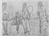
Нарьявалъ въ Монте-Карло. «Игроки въ теннисъ»—комическая группа.

— Женщины, чертъ возьми, отъкопъ, понимаете... А впрочемъ,—сразу узналъ онъ