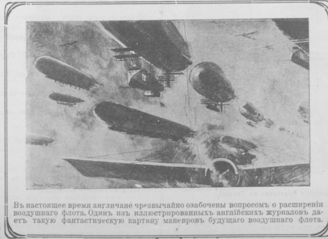
Въ настоящее время англичане чрезвычайно озабочены вопросомъ о расширеніи воздушнаго флота. Однимъ изъ иллюстрированныхъ англійскихъ журналовъ дается такую фантастическую картину маневровъ будущаго воздушнаго флота.

Онъ пронырски улыбнулся. — Ну, вотъ еще! Вышелъ изъ этого возраста. Нужно, собственно, не для меня, а для папаша.