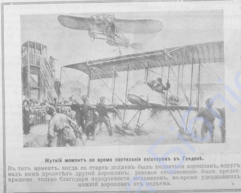
Жуткій моментъ во время состязанія салаторовъ въ Гердонѣ.

— Тотъ—перебилъ онъ, стуло спороговоркой, — въ ятвомъ класѣ съ безщитными глазами, въ седьмомъ—съ волгабуающимися колынами (п'онъ сдѣлалъ нѣсколько шаговъ походкой рамози — къ великому кон-