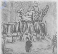
Нарьявалъ въ Монте-Карло. Одна изъ колесницъ съ «Синей птицею».