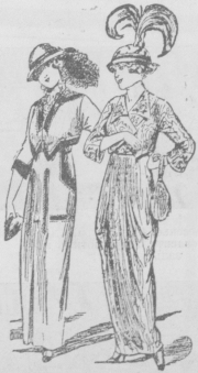
Возвратъ къ бѣлымъ. Вѣроятно, вѣдомъ изъ симаго шенота изъ чернаго Моге съ черными поло съ гарантуромъ сами, черными съ нѣтъ пестро-раскатышомъ и воротничкаго бѣлаго лопъ и покомъ изъ шелка. China-шелка.

Единственная развѣна—время дня, для котораго этотъ костюмъ предназначается. Въ то время, какъ мужской смокингъ является по вечерамъ, смюкингъ женскій будетъ служить для утренихъ и дѣшевѣхъ прогулокъ.