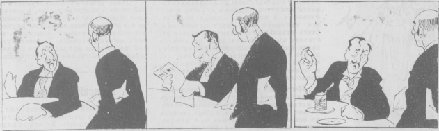
Рис. М. Липского.

— Почему порция блинов? О-го-го! Дешевле не было! А один блин? Дайте, в таком случае, бутерброд с маслом.