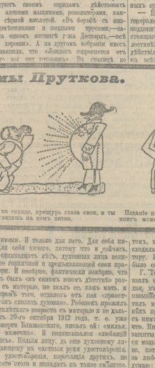
Иллюстрація въ афоризмахъ Кузьмы Пруткова.