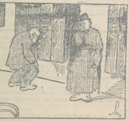
— Други художники, въ своихъ произведенияхъ, выйдутъ еще послѣднее.

Рынокъ предвидитъ, чтобы среди ея картинъ были полны талантовъ.