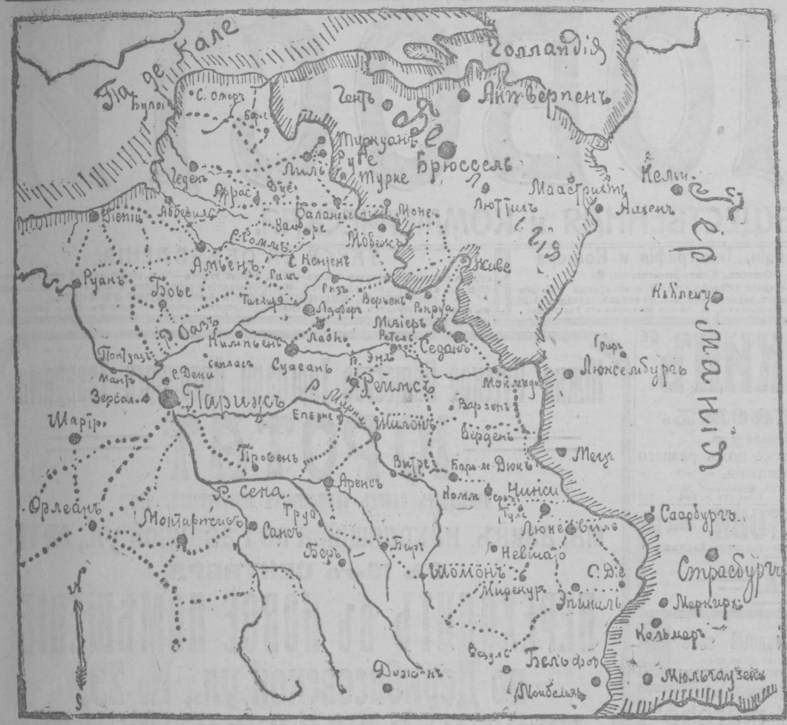
Карта французского театра войны.