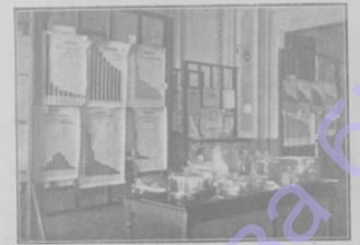
Одесса. Трудовая выставка в залах «Унион».