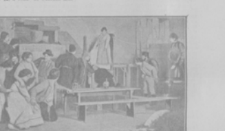
Игрок Рука и игрок Рука в шахматы.