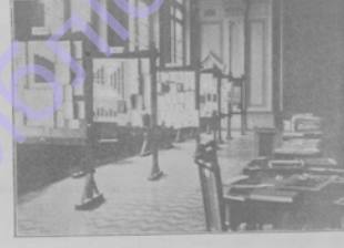
Одесса. Трудовая выставка в залах «Унион».