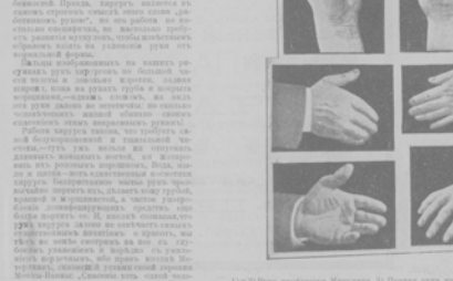
Игрок Рука и игрок Рука в шахматы.