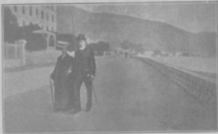
Проклятая дорога в Мариуполе в Митте.