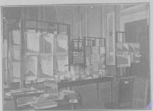
Одесса. Трудовая выставка в залах «Унион».