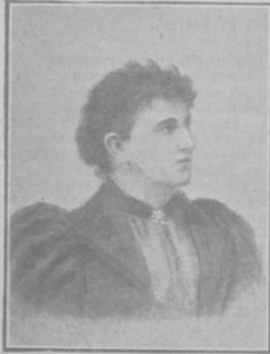
Пенистиа А. Н. Есипова.

...«Ого! уже прѣехали!» Послѣдовалъ обычный, по почему то всегда неожиданный толчекъ, чуть не свалившій съ ногъ всѣхъ пассажи-ровъ, и поѣздъ остановился. «Издъ на Соръ!»... услышались