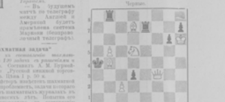
Игрок Рука и игрок Рука в шахматы.