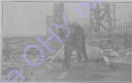
Казнь слона элентричествомъ въ Нью-Йоркѣ.

изъ забавнѣйшихъ картинъ человѣческой комедіи.