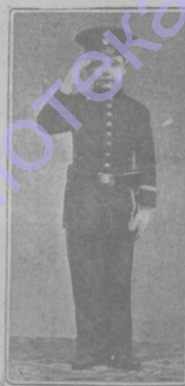
Принцъ Георгъ, будущій кронпринцъ 10 лѣтъ.