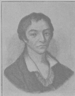
Илполитъ Ведоровичъ Богдановичъ, извѣстный поэтъ, авторъ „Душеньки“ (Къ исполненію ему 6 января 100-лѣтія его кончины).

Конечно, мы не все одиноки и для иныхъ изъ насъ также расцвѣтаетъ то счастье доставленія радости другимъ, на котромъ основана тайна лучшаго праздничнаго настроенія, но чистое, высокое наслажденіе отравляется отчасти ироніей надъ самимъ собою, отчасти горькой тоской по се-