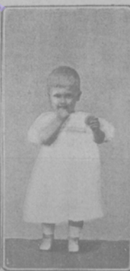
Принцъ Эрнестъ, 6 лѣтъ.