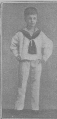
Принцъ Фридрихъ, 9 лѣтъ.