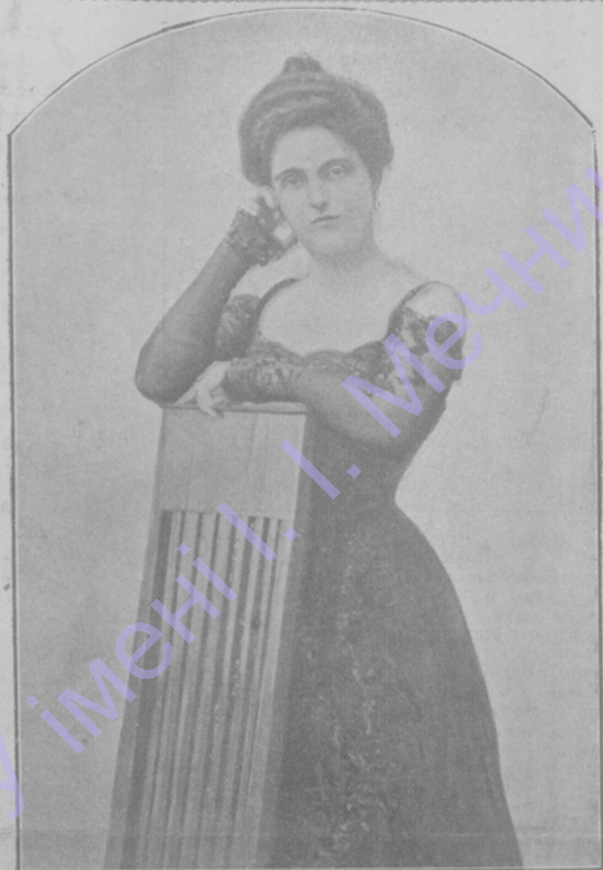
Кронпринцесса Саксонская. (Съ послѣдняго портрета, снятаго въ Женевѣ).