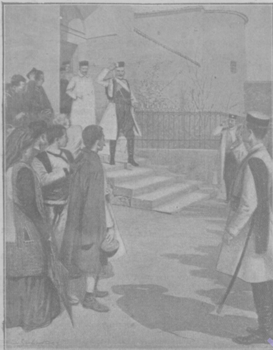
Новый годъ въ Черногоріи. Князь Николай поздравляетъ съ Новымъ годомъ.