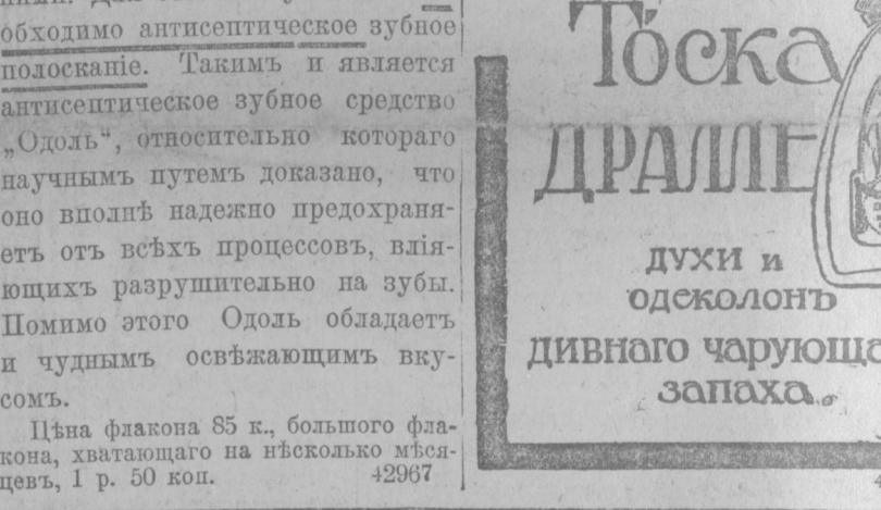
Духи и одсколотъ дивнаго шарующаго запаха.

Женщины-профессора. На вою Германію, съ 22 ноября, тамъ, до сихъ поръ, мѣлае толь женщины-профессоры.