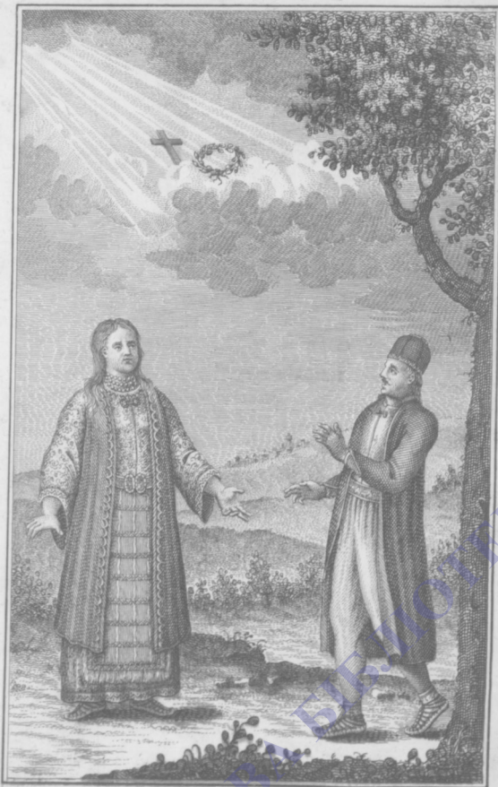
МАТИ СЕРБѢ И СЫНЪ СЕРБИНЪ.