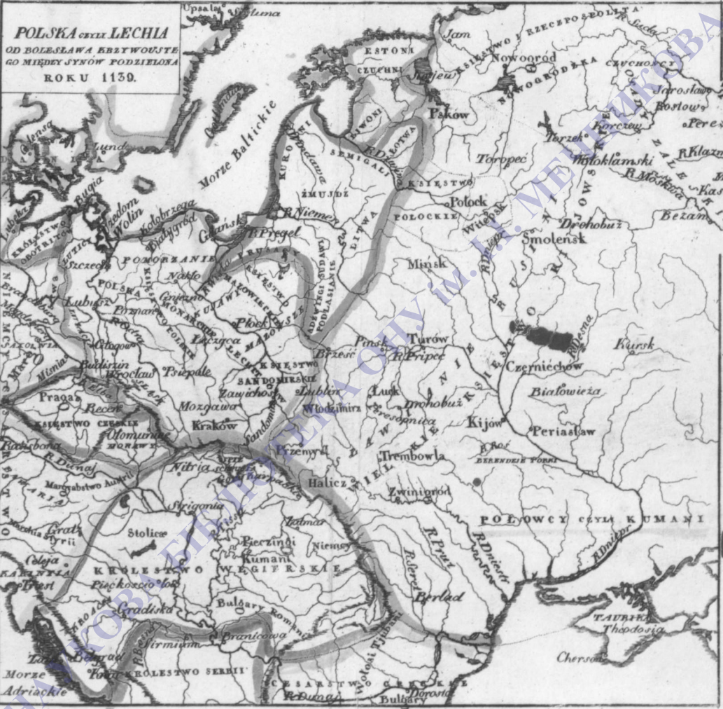
POLSKA CZYLI LECHIA OD BOLESŁAWA KRZYWOSTE GO MIĘDZY SYNÓW PODZIELONA ROKU 1139.