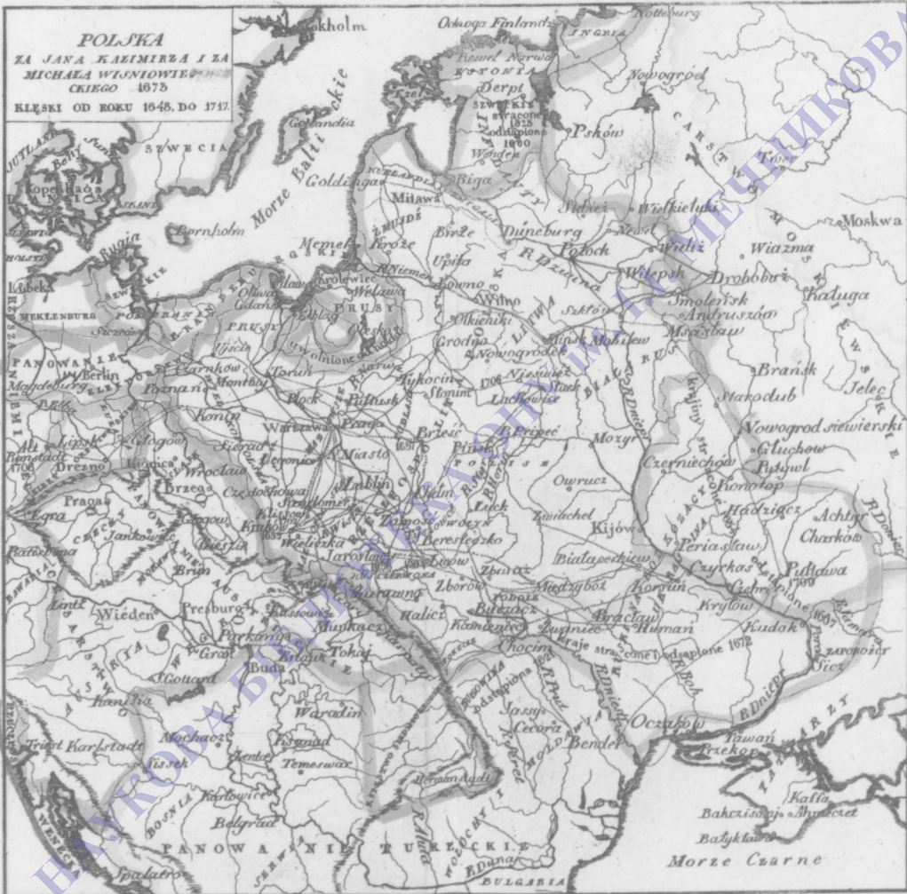
Szlaki Kozackie — Wojenne drogi: Karola Gustawa — Alexego — Ragociego — Mahometa — Karola III.