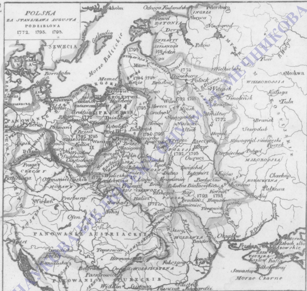
I. Prusy zachodnie. II. Prusy południowe. III. Prusy wschodnie. — IV. Galicja i Lodomeria. V. Galicja nowa