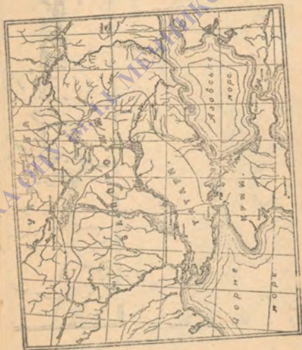
Карта Вольностей війська запорізького.