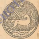
Печатки Самарської та Кодацької паланок.

Помічені найважливіші друкарські помилки.