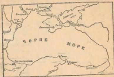
Карта Чорного моря та торгових центрів.