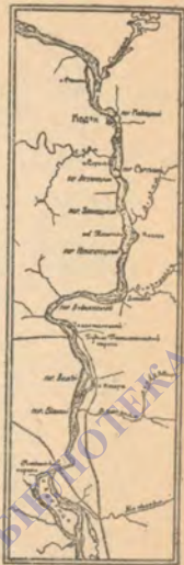
Карта порожистої частини Дніпра.