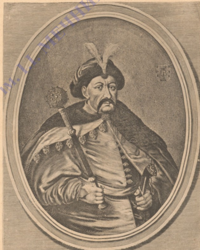
BOHDAN CHMIELNICKI EXERCITUS ZAPOROVIEŃ PRÆFECTUS BELLI SERVILIS AUTOR REBELLUMQ̄ COSACCORUM ET PLEBIS UKRAÏNEN