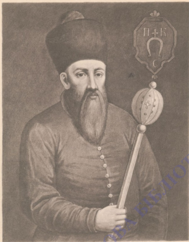
ПЕТРЪ КОНАШЕВИЧЪ САГАЙДАЧНЫЙ.