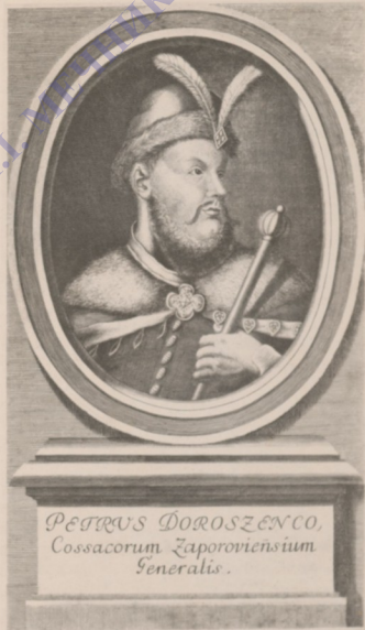
Petrus Doroshenko, Cossacorum Zaporoviensium Generalis.