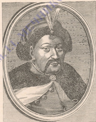
BOHDAN, CHMIELNICKI. Exercitus Zaporouien Præfectus, Belli Seruilis autor, Rebelliumq; Cofaccor et Plebis Ukrainen dux.