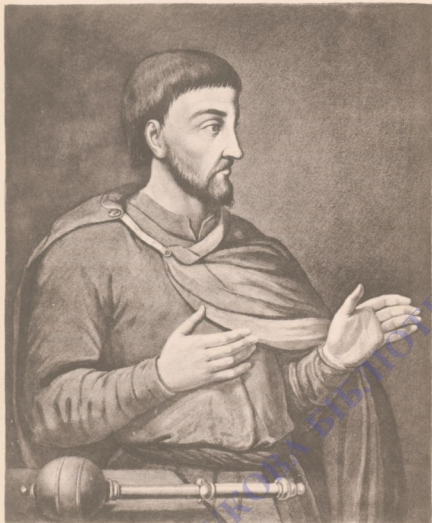
ДЕМЬЯНЪ ИГНАТЬЕВИЧЪ МНОГОГРЪШНЫЙ.