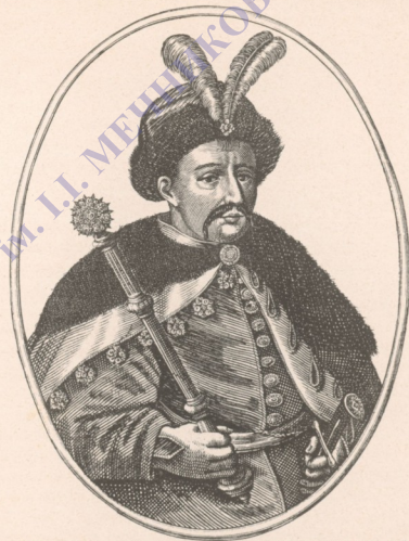
Bohdan CHMIELNICKI, EXERCITVS ZAPORQ phionorum Praefectus, Cofaciorum & Kranyonsium Dux.

Не успѣвъ Хмельницкій окончить регистрацію козацкаго войска, какъ противъ него обнаружилось сильное возмущеніе и недовольство въ средѣ простонародья, не вошедшаго въ козацкій реестръ. Уступая этому движенію, гетманъ объявлялъ, что, кромѣ реестровыхъ, могутъ быть еще и охочіе полки, куда можно идти всякому. Между тѣмъ на Украину стали возвращаться изгнанные раньше помѣщики-полки и начали требовать отъ своихъ подданныхъ восстановления прежнихъ обязательныхъ отношеній. Крестьяне ни за что не хотѣли исполнять ихъ требованій и въ большихъ случаяхъ снова изгоняли или убивали своихъ пановъ. Гетманъ вынужденъ былъ не разъ издавать универсалы, въ коихъ строго приказывалъ, чтобы невшедшіе въ реестръ повиновались своимъ прежнимъ помѣщикамъ, ослушаннымъ