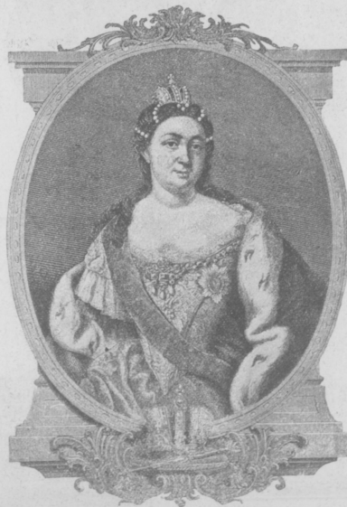
Императрица Екатерина I Алексѣевна, супруга Петра Великаго.