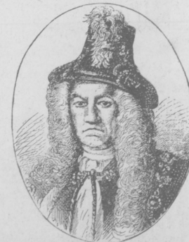
Графъ Я. Е. БРЮСОВЪ.

Нѣтъ? Тѣмъ хуже для васъ, друзья мои. Какъ разъ въ это время, пропитанная приятной влажностью, съ распространяющимися повсюду весенними