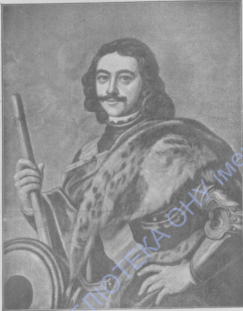
Императоръ Петръ Великій, основатель Петербурга.