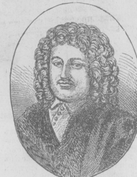
Графъ В. А. ГОЛОВИНЪ.

Говорили ли вы когда-нибудь слова любви въ этихъ аллеяхъ?