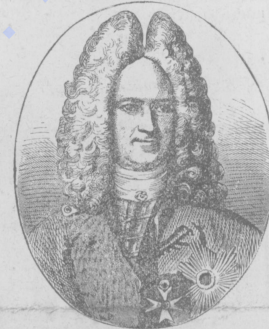
Свѣтлѣйшій князь А. Д. МЕНШИКОВЪ.