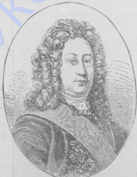
Графъ Б. П. ШЕФЕМЕТЕВЪ.