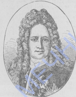
Графъ Г. И. ГОЛОВКИНЪ.