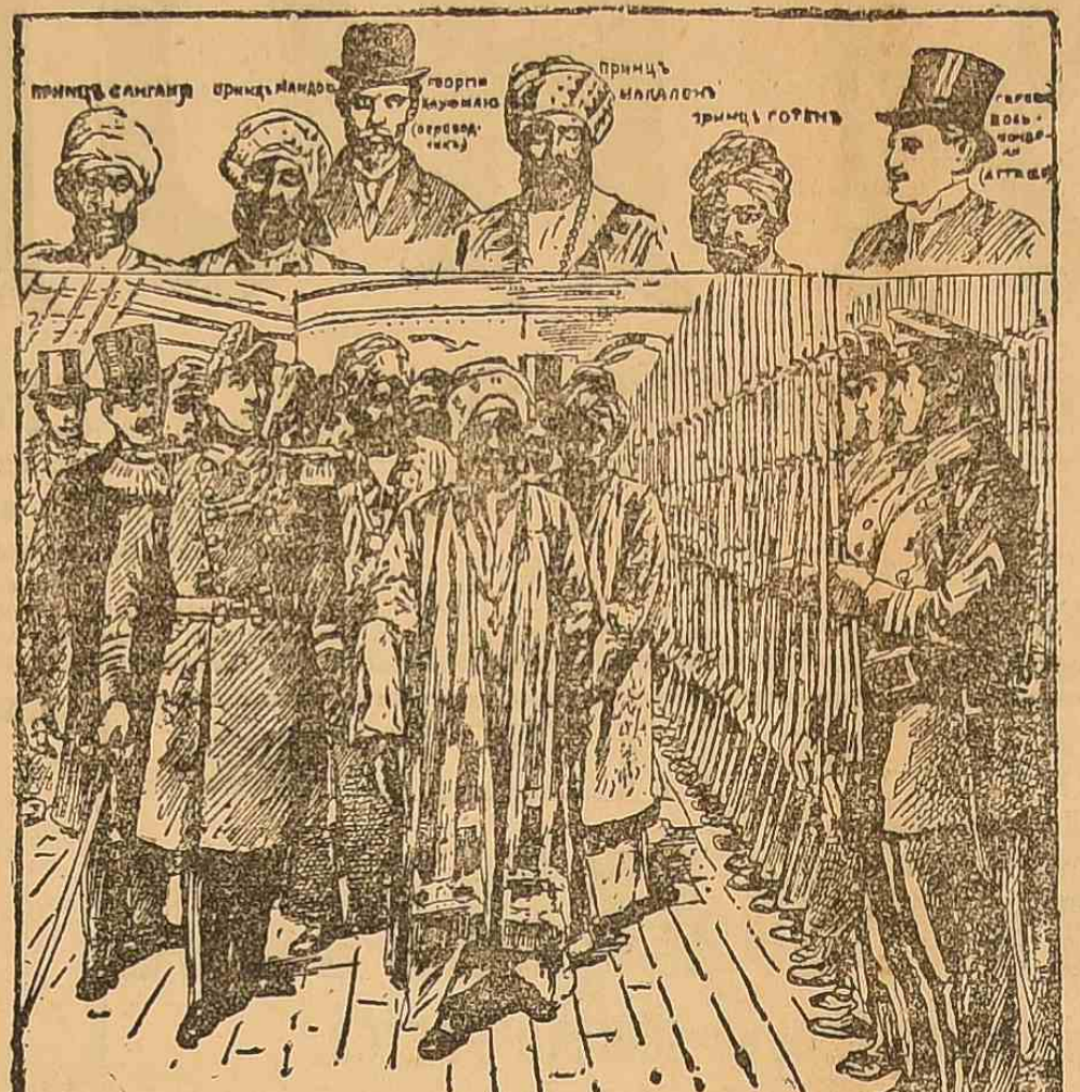
Иллюстрация к статье о мистификации.

Смотрь английской флота поддельными придами.