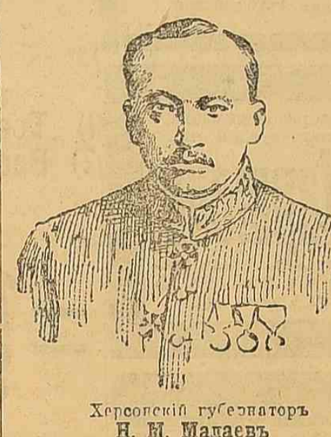
Херсонскій губернаторъ Н. М. Малавѣвъ (въ лѣвѣхъ сплеча).