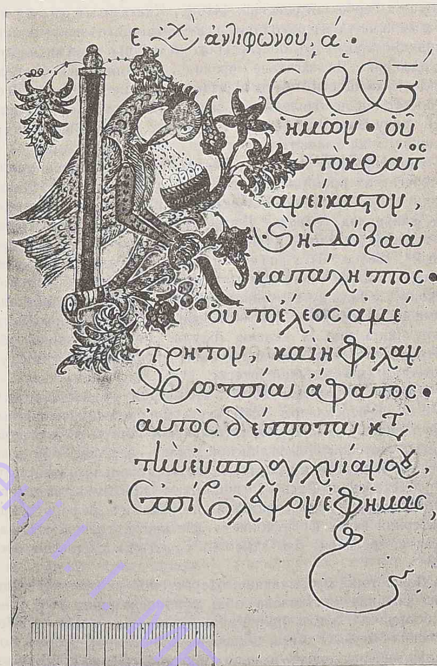
Сторинка „Читань Євангельських на різні свята“ XII—XIII в. \frac{1}{5} натур. розміру.

Сербського, — зразком, що має на собі сліди руйницького впливу часу, перед яким папір міг устояти незрівняно менш,