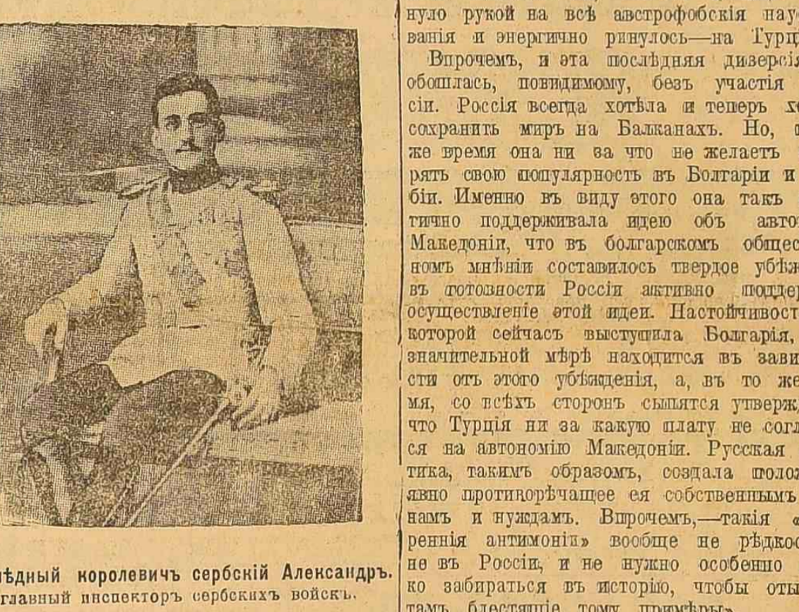
Наставный королевичъ сербской армии Александръ.

дарственные дѣлать собирать въ... (text continues)