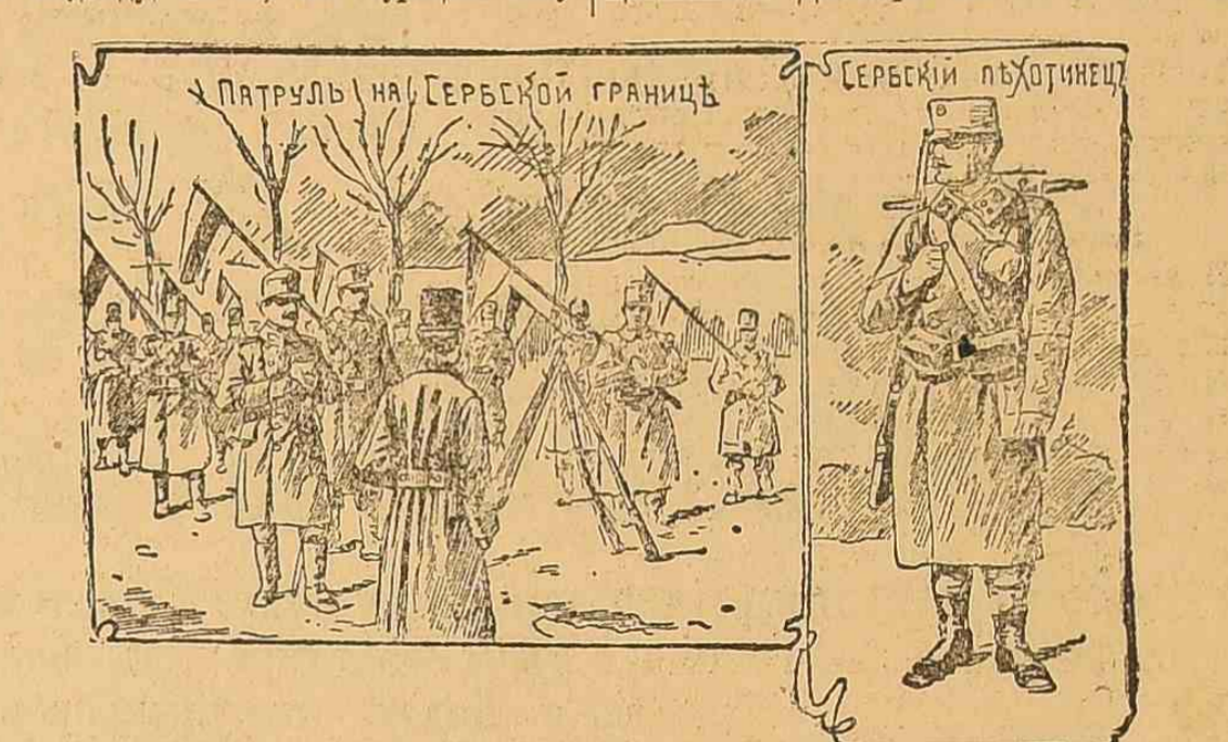
Патруль на Сербской границе. Сербский солдат.

Франции, где мы его пробовали. Въ... (text continues)