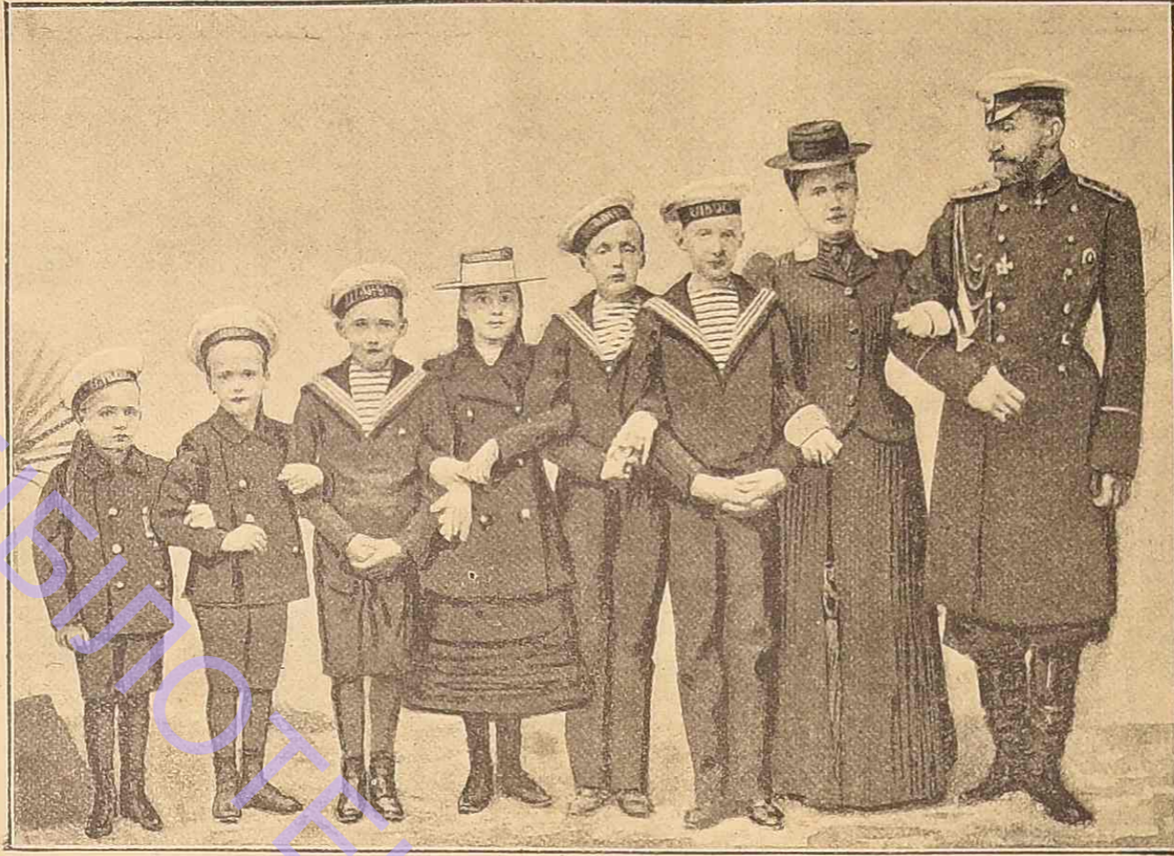
Ихъ Императорскія Высочества Великій Князь Константинъ Константиновичъ, Великая Княгиня Елисавета Мавриевна и Ихъ дѣти.

Меблированная комната пижигго этажа, выходившая въ этотъ садикъ, походила на тѣ, которыя вообще отдаются въ наемъ; — съ желѣзной односпальной кроватью безъ алькова, старымъ диваномъ неопредѣленнаго цвѣта, ореховымъ шкапомъ, замѣвающимъ комодъ, столикомъ, стульями и однимъ кресломъ. Всѣ вещи — безъ выраженія, безъ значенія, безъ воспоминаній; пыль и слѣды разрушенія на нихъ еще болѣе выдѣляли