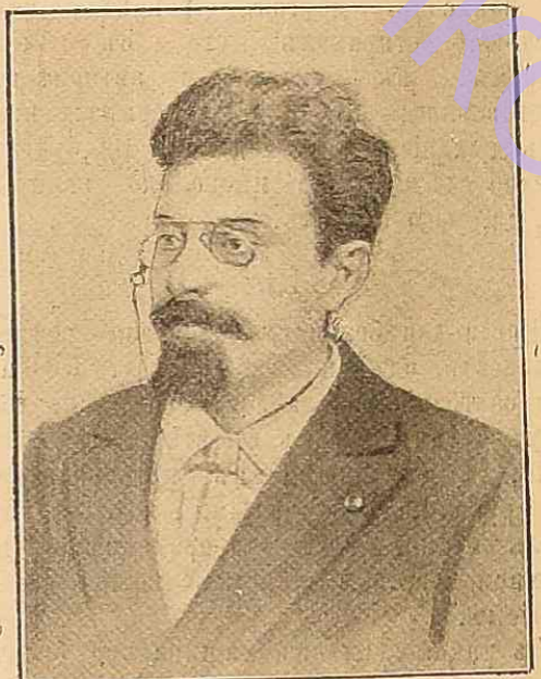
Д-ръ М. Вучичъ, [новый] президентъ министровъ въ Сербіи.

вой, какъ-бы покоряясь въ борьбѣ съ невидимой силой. Выходя, ояъ произнесъ обыкновенную таинственную фразу, одинъ изъ самыхъ темныхъ и загадочныхъ отвѣтовъ науки: «Пока есть дыханіе, — есть надежда». Для присутствующихъ около серьезно-больного это должно, напротивъ, означать, что нѣтъ