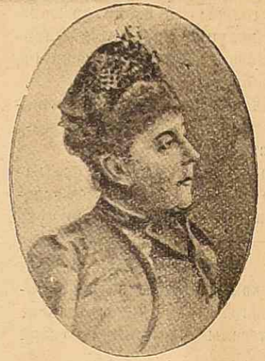
Принцесса Луиза Прусская. † 6-го мая с. г.

вой, какъ-бы покоряясь въ борьбѣ съ невидимой силой. Выходя, ояъ произнесъ обыкновенную таинственную фразу, одинъ изъ самыхъ темныхъ и загадочныхъ отвѣтовъ науки: «Пока есть дыханіе, — есть надежда». Для присутствующихъ около серьезно-больного это должно, напротивъ, означать, что нѣтъ