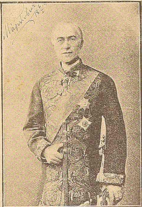
Сенаторъ А. Н. Марковичъ, помощникъ главнаго попечителя Императорскаго человеколюбиваго общества. (Къ исполняющемуся 14 мая с. г. 50-лѣтію его дѣятельности.)