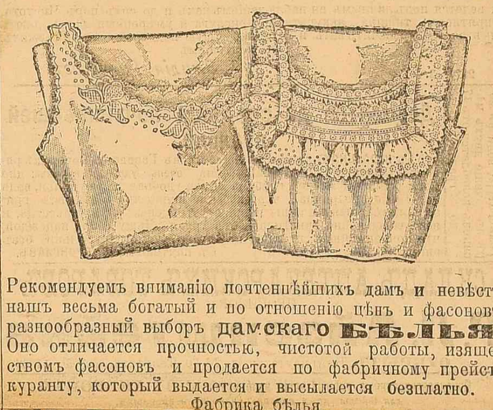
Рекомендуемъ вниманию почтеннѣйшихъ дамъ и невѣстъ нашь весьма богатый и по отношению цѣвъ и фасоновъ разнообразный выборъ дамскаго платья.