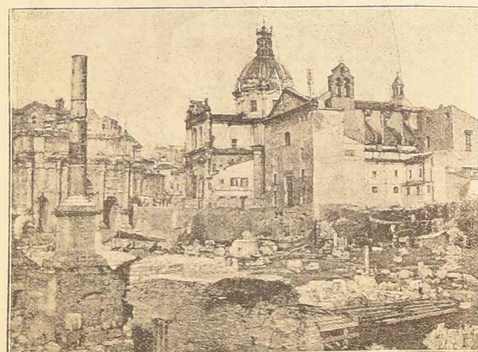
Новыя раскопки на мѣстѣ римскаго форума.—Базиллика Эмилии.