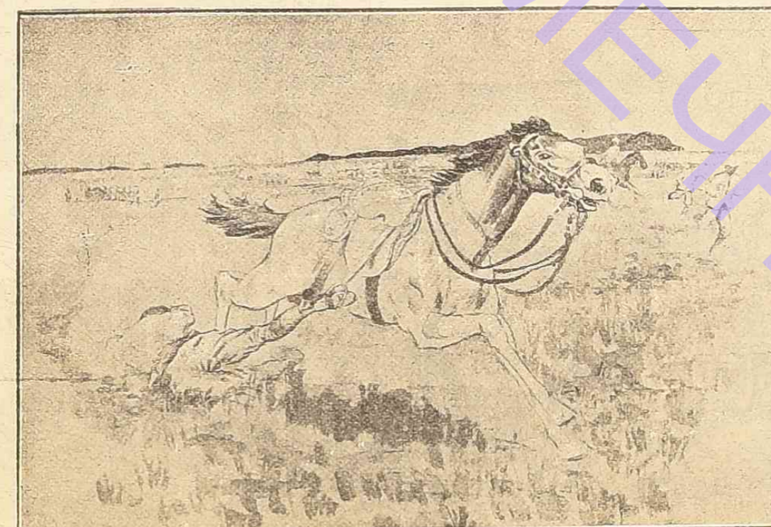
ВОЙНА.—Инцидентъ въ англійскомъ лагерѣ.—Глбелъ солдата, выбитого изъ сѣдла.