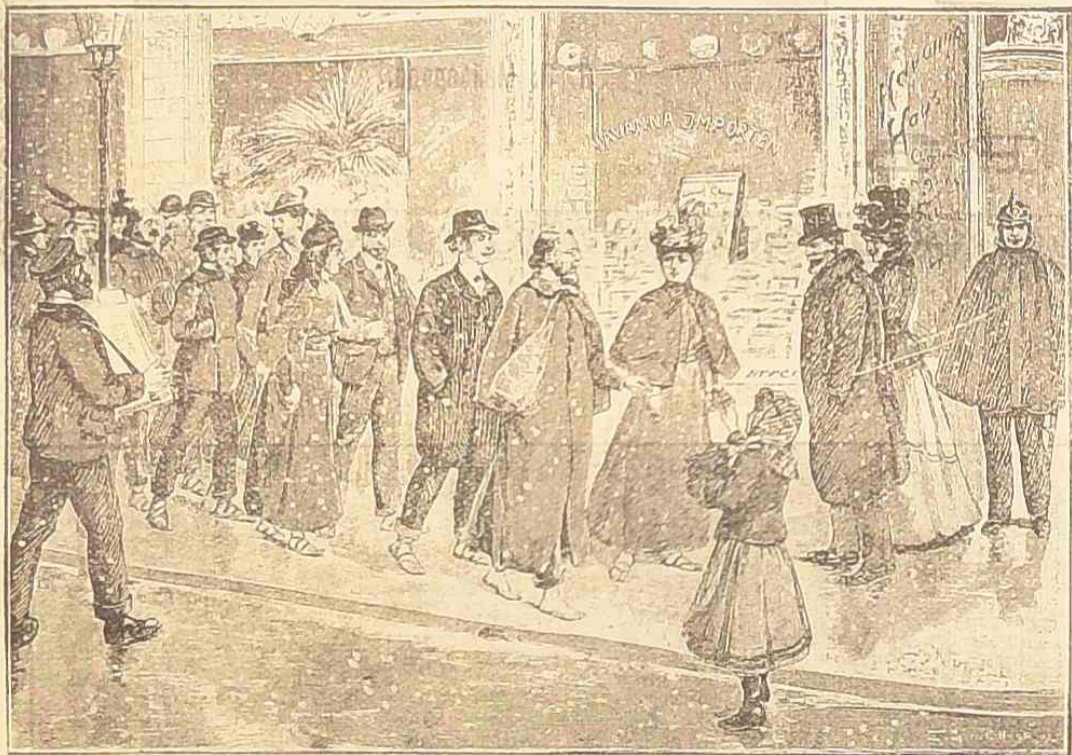
Прогулка послѣдователей пастора Кнейпа по улицамъ Берлина.