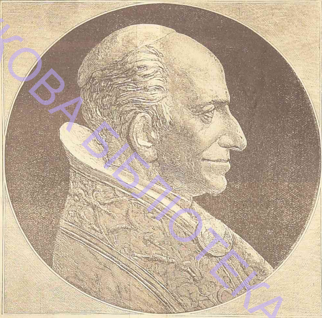
Папа Левъ XIII. (По случаю 90-лѣтія рожденія).