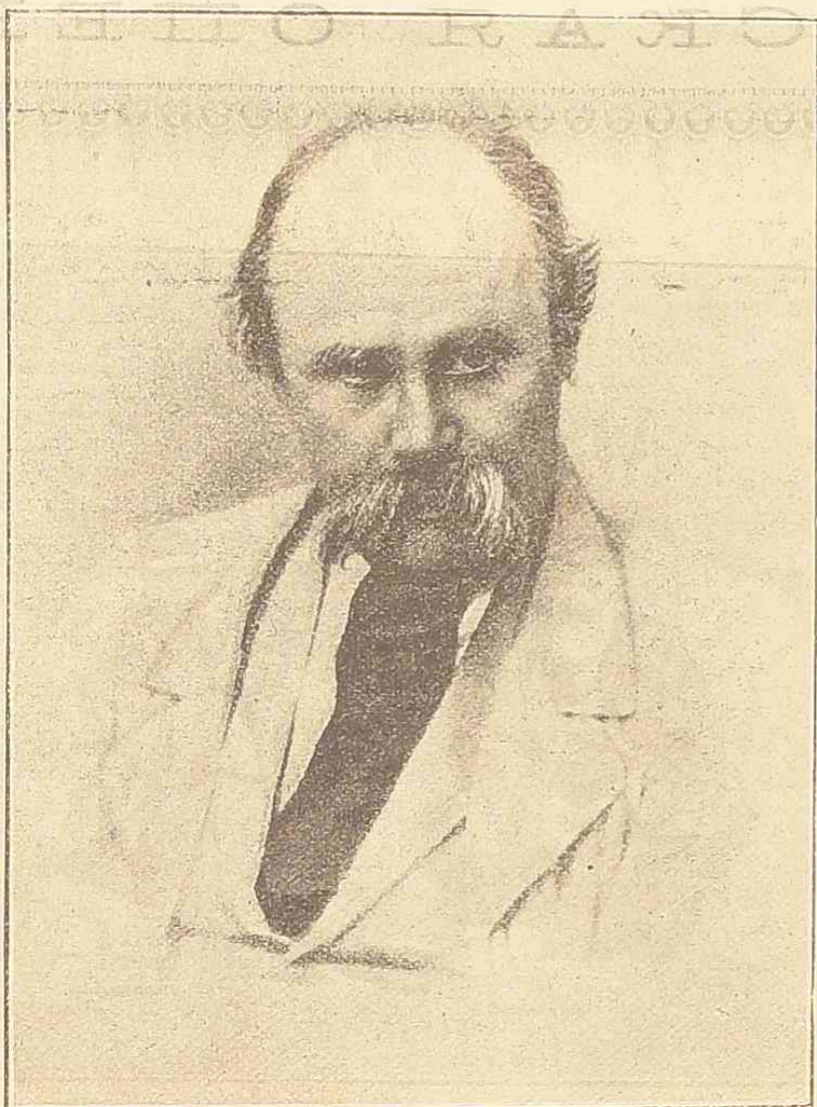
Тарасъ Шевченко (по случаю годичныя смерти). 1861—26 февраля—1900.

Изъ этого списка видно, что императоръ Вильгельмъ II могъ-бы смѣло своимъ ружьемъ прокормить весь свой дворъ, конечно, при тѣхъ условіяхъ, въ которыхъ прошехидитъ королевскія охоты... Импера-