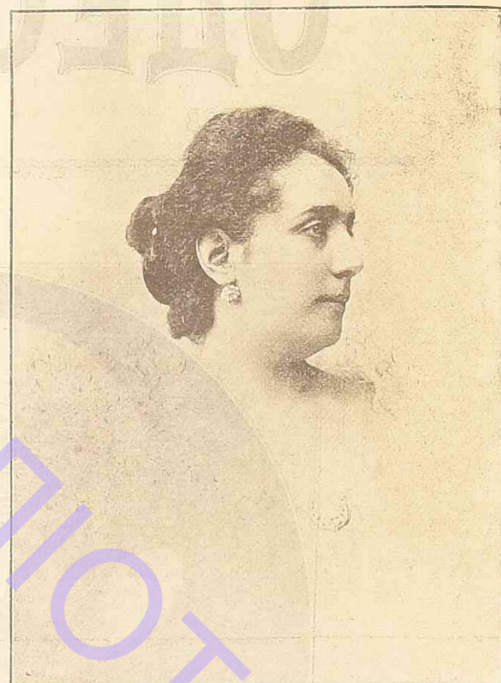
М. Н. Фигнеръ.