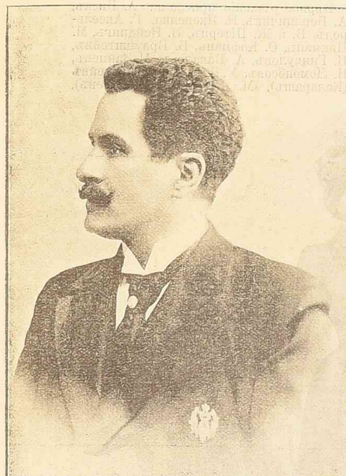
Н. Н. Фигнеръ.