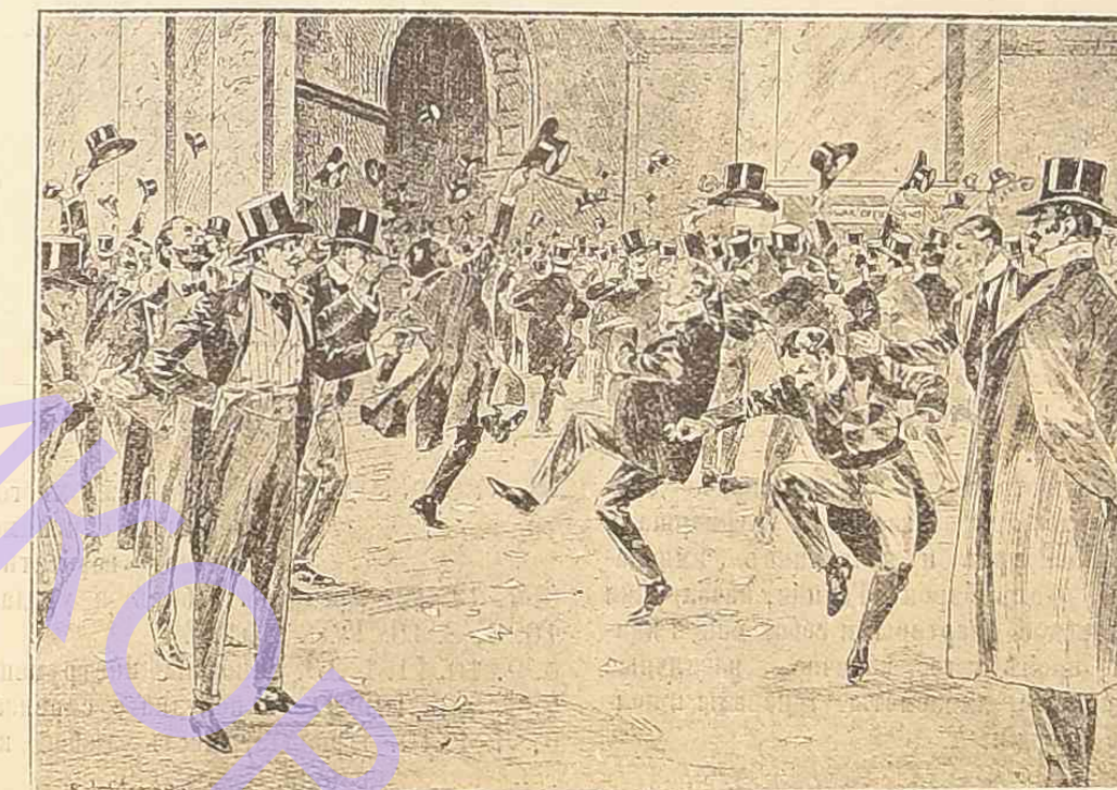
ВОЙНА.—Какъ лондонская биржа встрѣтила извѣстіе о капитуляціи Кронъе.