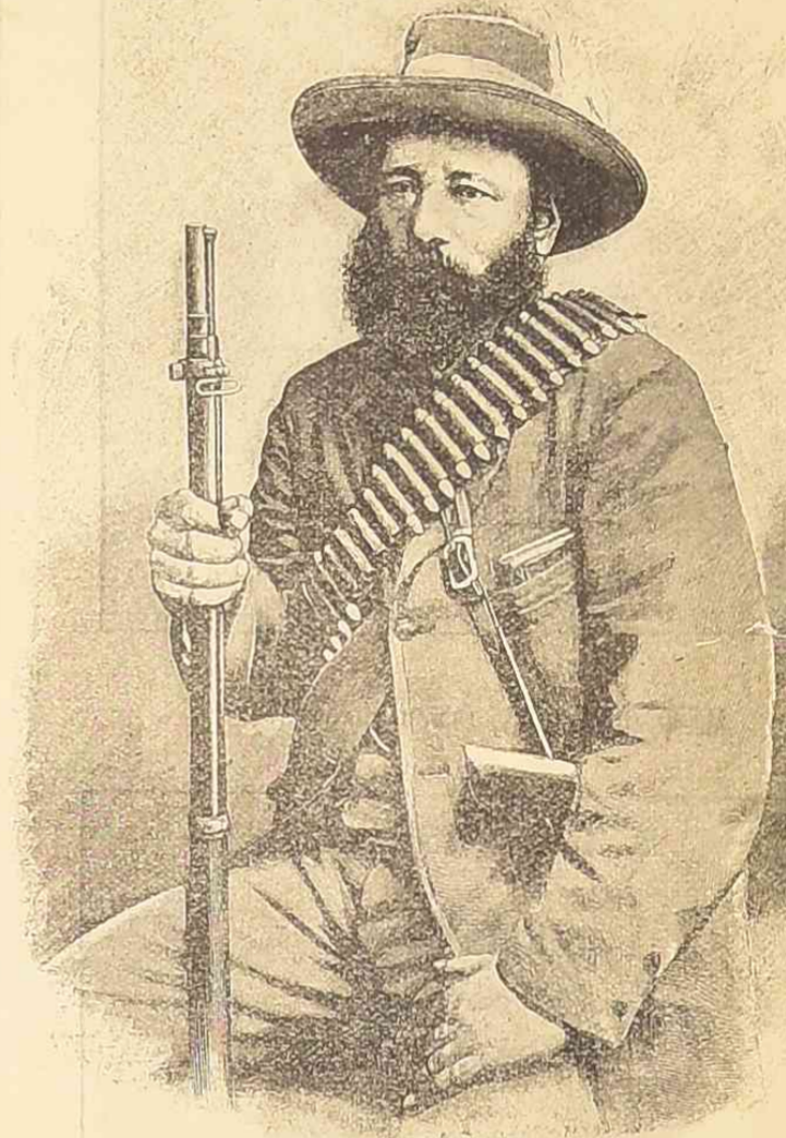
Генераль Кронзе въ походномъ костюмѣ. (Съ послѣдняго сраженія).