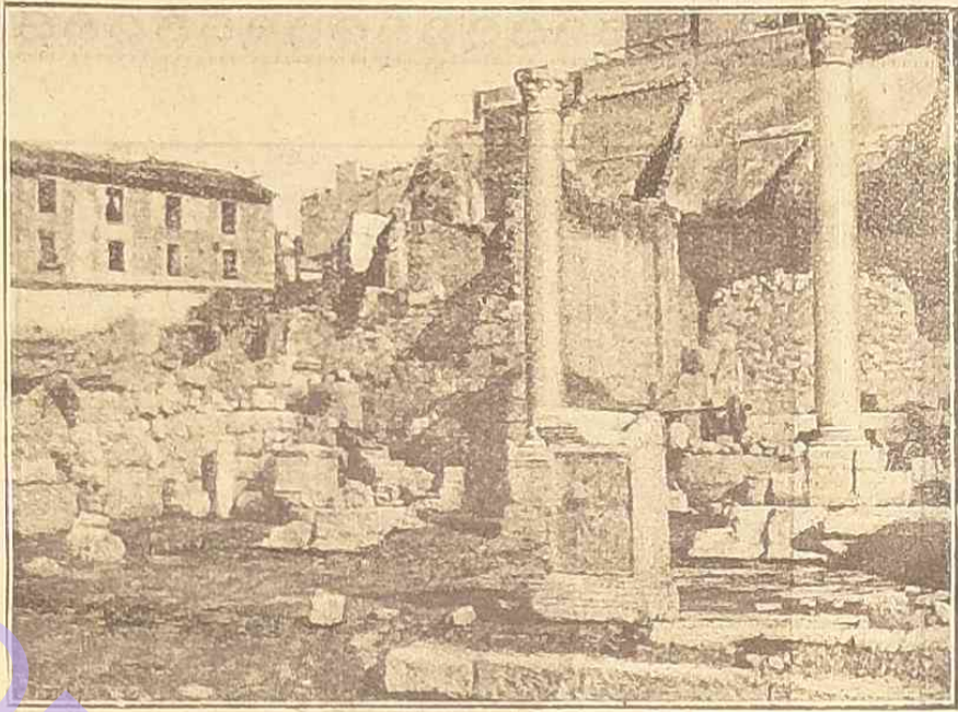
Новыя раскопки на мѣстѣ римскаго форума.—Общій видъ мѣстности, гдѣ производится раскопки.