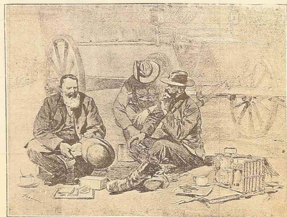
ВОЙНА.—Генераль Жуберъ за завтракомъ передъ „дѣломъ“.