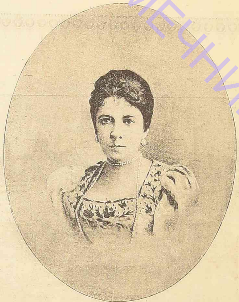
Марія Гавриловна Савина, заслуженная артистка Императорскихъ театровъ. (По поводу гастролей въ Одессѣ).