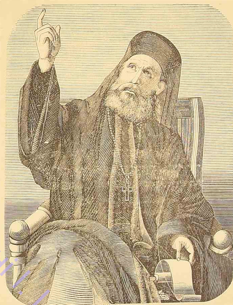
Ο Οἰκουμενικὸς Πατριάρχης Γρηγόριος ὁ Ε΄.

Еще раньше — въ 1821 г., когда Греція пережила бурный періодъ возстанія за освобожденіе отъ турецкаго ига, одесская Греческая церковь сыграла немаловажную роль, какъ свѣточъ, къ которому собирались всѣ проживающіе на югѣ Россіи вѣрные сыны Эллады и которымъ они вдохновлялись на борьбу съ тяжелымъ игомъ. А особенное значеніе получила церковь послѣ того, какъ въ 1821 г., въ Константинополѣ произошло событіе, вызвавшее своею несправедливостью и жестокостью, бурю негодованія во всемъ цивилизованномъ мірѣ. Въ Великій праздникъ Пасхи, константинопольскій Патриархъ Григорій, по распоряженію турецкаго Правительства, былъ схваченъ, звѣрски убитъ и тѣло его брошено въ море. Промыселъ Божій пожелалъ, чтобы теченіемъ тѣло Патриарха было прибито къ борту стоящаго въ Босфорѣ греческаго корабля и, по опознаніи его, было доставлено на этомъ же кораблѣ въ Одессу. Неожиданное прибытіе корабля съ драгоценнымъ грузомъ въ Одессу, въ то полное тревогъ и надеждъ для всѣхъ эллиновъ время, не могло не вызвать живѣйшаго интереса не только среди проживающихъ въ Одессѣ эллиновъ, но и среди прочаго православнаго населенія города. По ВЫСОЧАЙШЕМУ повелѣнію тѣло Патриарха, съ невиданной до того торжественностью, было перенесено изъ Собора, гдѣ оно временно покоилось, въ Греческую Свято-Троицкую церковь и предано землѣ въ самой церкви, у сѣверной стѣны ея. Церковь, ставшая первою усыпаль-