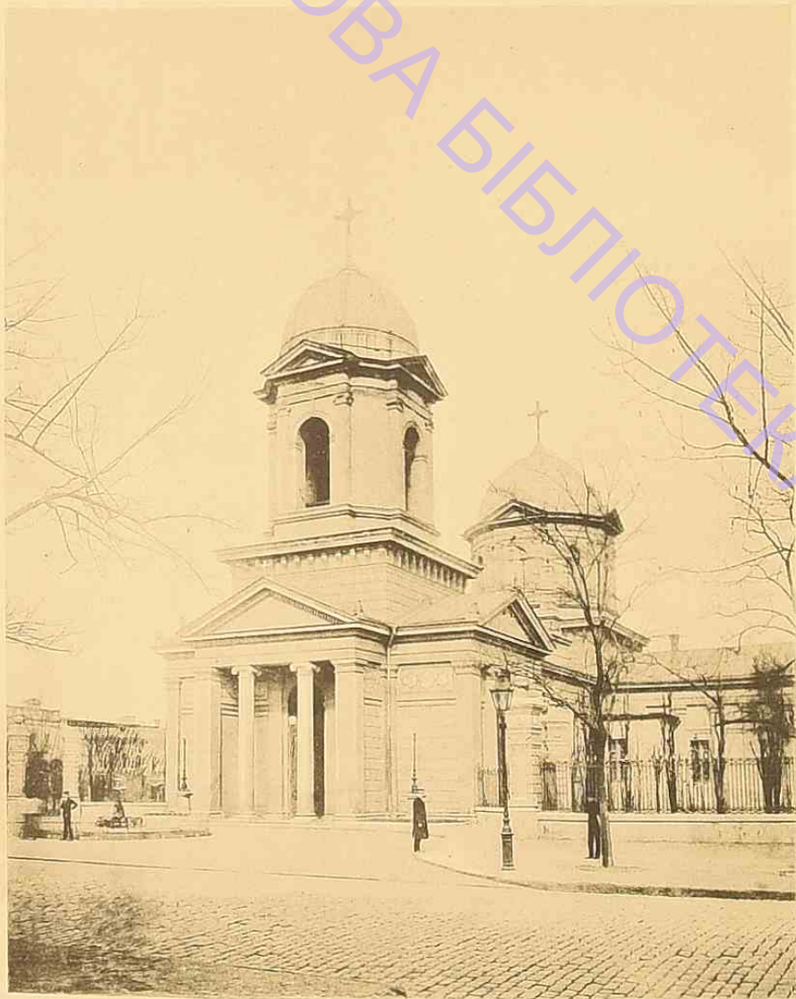
Ἡ ἐν Ὀδησσῶ Ἑλληνικὴ Ἐκκλησία ὡς ἔχει σήμερον.