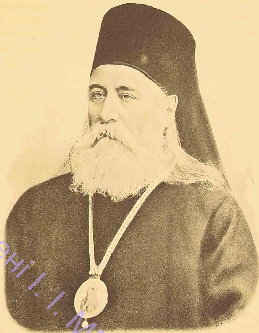
Димитрій Архіепископъ Херсонскій и Одесскій.

Греческая церковь имени Святой Троицы, какъ видно изъ предыдущаго описанія, была заложена и построена посрединѣ квартала, между улицами нынѣ Троицкой, Еватерининской и Успенской и имѣя съ восточной стороны рядъ частныхъ домовъ, выходящихъ фасадомъ на Ришельевскую улицу. На этомъ обширномъ мѣстѣ, кромѣ зданія самого храма, находился небольшой одноэтажный домъ на углу Троицкой и Еватерининской улицъ, какъ было выше указано, гдѣ до 1808 г. помѣщалась временная Греческая церковь и училище, а въ послѣдствіи служившій помѣщеніемъ для Настоятеля церкви и со стороны Успенской улицы небольшой полутораэтажный домъ, въ которомъ жили и по сей день живутъ лица, принадлежащія къ составу церковнаго причта. Съ теченіемъ времени личный составъ причта Греческой церкви значительно увеличился, а между тѣмъ помѣщенія, въ которомъ онъ проживалъ, пришли въ ветхость и самъ собой назрѣлъ вопросъ о болѣе удобномъ