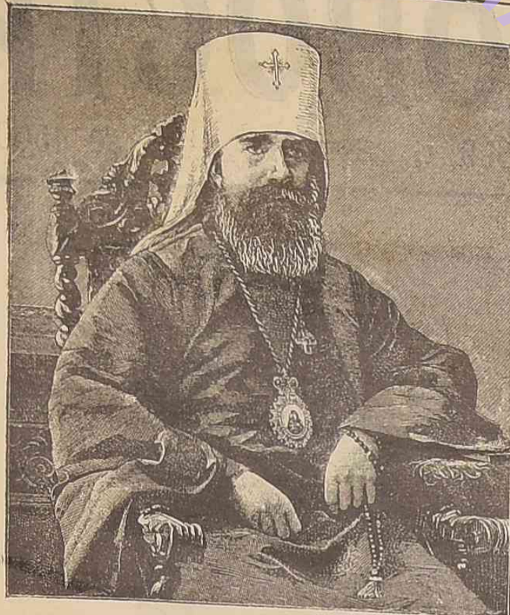
Высокопреосвященный Антоній, Митрополитъ С.-Петербургскій и Ладожскій.