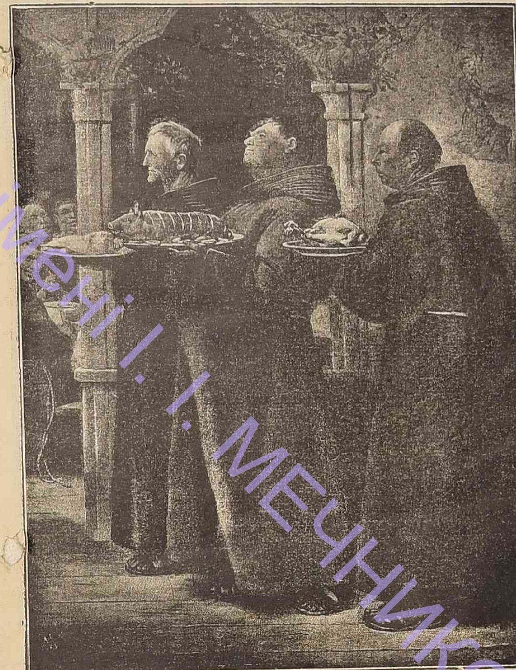
Праздникъ въ монастырѣ.

— Садитесь ужъ рядомъ со мной, г. Жакобу, я сообщу вамъ новость. Мы убиваемъ однимъ зарядомъ двухъ зайцевъ: празднуемъ встрѣчу Нового года и споскиваемъ обрученіе Францелины съ лѣсничимъ Содансень... Возьмите-ка стаканъ вина, да чокнитесь съ нами... Послѣ Крещенія ихъ свадьба.